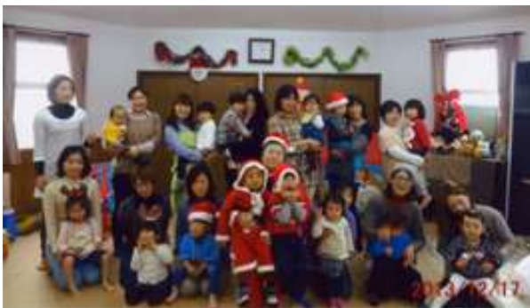
クリスマス会（昨年12月）