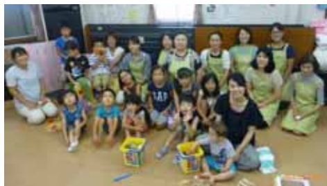
7/21 子育てサロンまつぼっくり