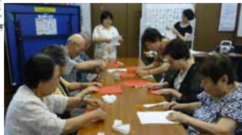
7/15 松の実会 夏祭り花飾り作り

3カ月に1度はお楽しみ会を開催しています。 ※お手伝いしていただけるボランティアの方を募集しております。