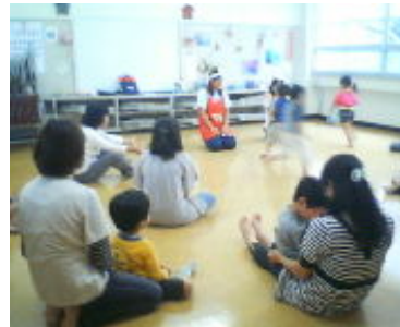
鶴が台保育園の先生と となりのへやで