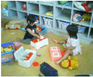
仲良く、おままごと