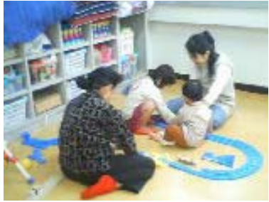
二組の保護者と子どもが 家族のようです