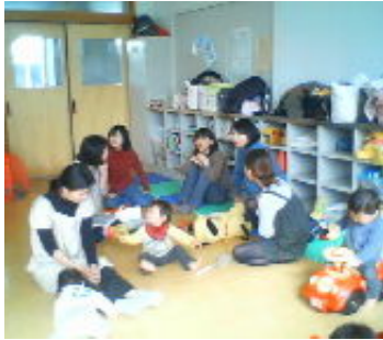
みんなでおしゃべり