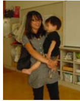
遊んだあとは抱っこ!