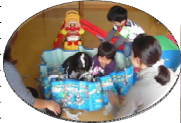
新聞のプールは きょうも大騒ぎ !