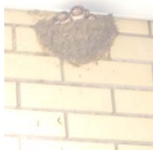
つばめのこどもたち 親つばめは出たり入ったり忙しい

◆ ふくやまのおっかけ! ▽ においのしない物ならみんな好き 「やってみたいこと = エキストラ!!」