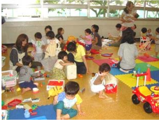
おともだちと遊ぶ子、ひとりでもくもくと阿蘇も子、 おばちゃんやおねえさんと遊ぶ子