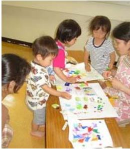
おりがみ貼ってあじさい作り カエルさんも、雨さんも