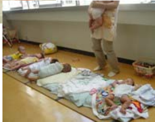
ねんねの赤ちゃんがいっぱい!