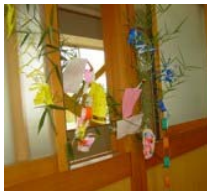
みんなで、たなばた飾りをつくりました。