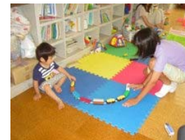
写真は中学1年のユース、電車が長くつながったね。