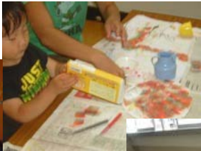
うちわにお絵かき スタンプも