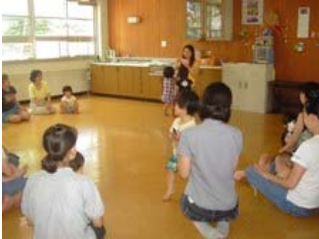
保育士さんと一緒