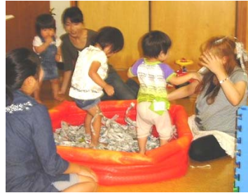
室内のプールは新聞紙