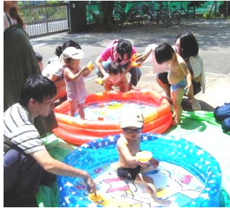
外のプールはお水