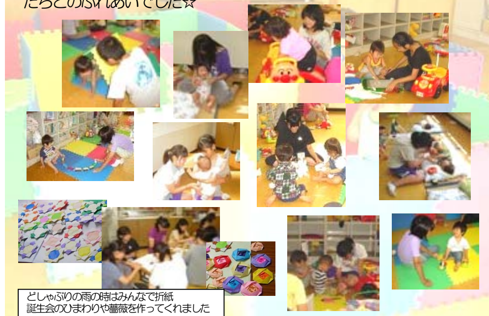
どしゃぶりの雨の時はみんなで折紙誕生会のひまわりや薔薇を作ってくれました

♪たくさんのユースボランティアの方たち、ありがとうございました♪ ※ご理解・ご協力いただいたママたち、ありがとうございました※ ☆ママ達も子どもたちもユースたちも、普段接することの少ない年代の人たちとのふれあいでした☆