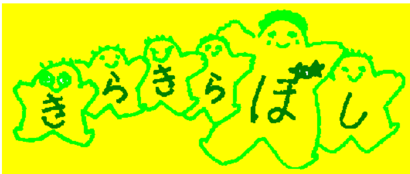
後援 湘北地区社会福祉協議会、茅ヶ崎市コミュニティ保育推進事業