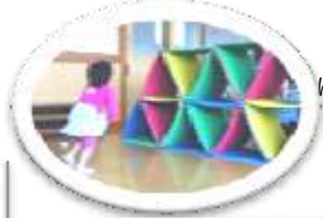
ゆめちゃんも 卒業