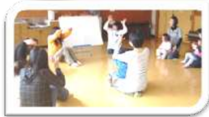
保育士さんといっしょに