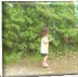
なかなかりれない