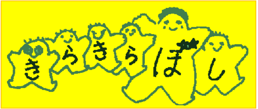
後援 湘北地区社会福祉協議会、茅ヶ崎市コミュニティ保育推進事業